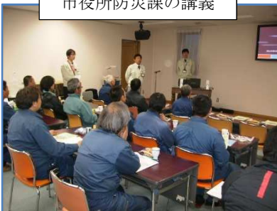
市役所防災課の講義

平成 26 年 3 月 13 日（木）に、狭山市役所防災課より出前講座をお願いし、地震の起きやすい地域、地震の種類、地震が起きたときの対策等について講座を受講しました。緊急時に混乱状態にならないようまず身の安全を確保し、速やかに避難することが大事であると、ご指導を頂き大変有意義な勉強でありました。同日、株式会社タイヤセンターシブヤ様より、タイヤの基礎知識、点検の仕方、ローテーション、取替時の留意点、サイズの確認方法等についてご指導頂きました。