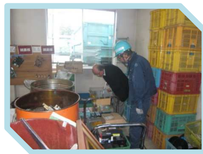
分別作業所のチェック