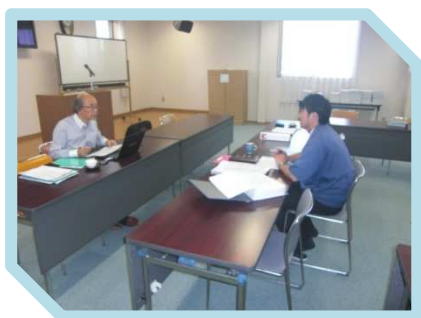
冒頭の経営者インタビュー

今後とも ISO のノウハウを経営に生かし、よりお客様のニーズに的確に対応できるよう努めて参りたいと存じます。