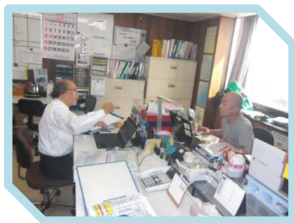
営業部のヒアリング