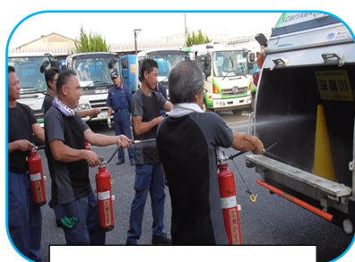
実際に消火訓練を実施