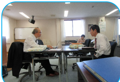
トップインタビューの様子

令和元年8月22日～23日及び10月9日～11日、それぞれの外部審査により情報セキュリティ（ISO 27001）と労働安全衛生（OHSAS 18001）の更新審査を受け、規格要求事項に適合していると評価を受け、認証を更新する運びとなりました。これも一重にお客様を始めとする関係者各位方々のお力添えの賜物と思っています。これからも認証に恥じない事業活動を行い、お客様のご要望に応じていく所存で御座います。今後とも、廃棄物処理のご用命は安心して小見山商事へお任せ下さい。