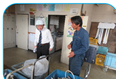
本社現場の状況を視察

【有害物質・危険物質混入防止のお願い】平素は小見山商事をご利用頂き厚く御礼申し上げます。さて、廃棄物を排出する際、下記のような危険物混入防止にご協力をお願い致します。