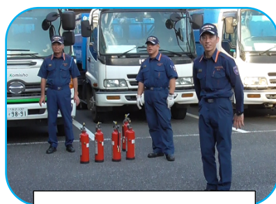
消防士より訓練後の講評