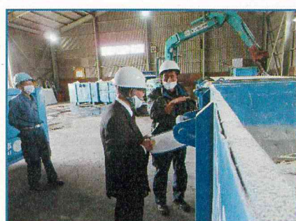
廃棄物保管の視察