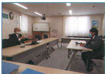
トップインタビュー

さて弊社は情報セキュリティ（ISO27001）の更新時期を迎え、外部審査機関にて更新審査を10月11日～14日に受審しました。審査員からは「規格要求事項に対する明確な抵触は無く、本来業務は運用規定に則り適切に遂行されている」との講評を頂きました。これも全てお客様のその他関係者各位方々のお力添えの賜物であると御礼申し上げます。